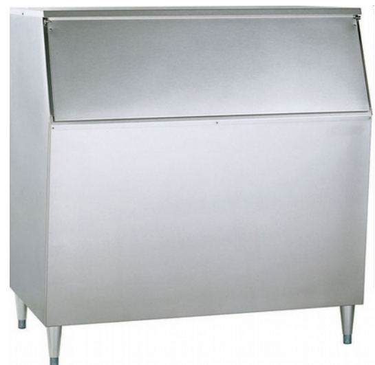
D430 - D460