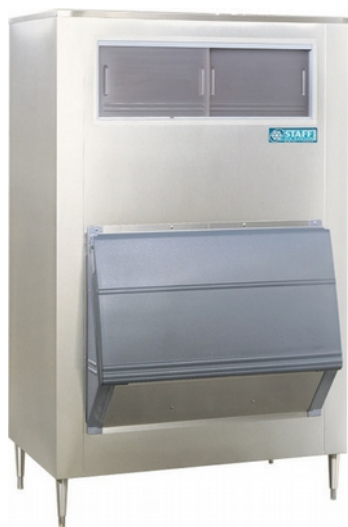
SG500-30 / SG700-30