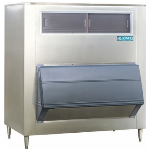
SG1010-48 / SG1475-60